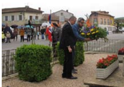
La cérémonie du 8 mai 2018.