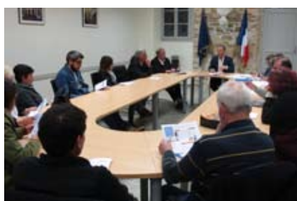
Réunion du Conseil Municipal le 14 mai.

A l'occasion de ce nouveau numéro du de tu a jo, et en attendant les beaux jours de l'été qui nous permettrons de profiter de la piscine municipale, du spectacle de l'UDAC, de la fête de village et de bien d'autres animations, je souhaite aborder une action importante qui concerne l'amélioration de l'habitat sur Le Fossat.